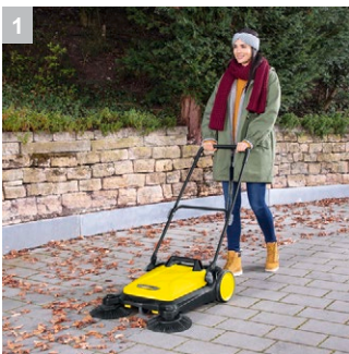
1 Две пары боковых щеток

Подметальная машина S 4 Twin 2 в 1 с рабочей шириной 680 мм, 2 стандартными боковыми щетками и 2 специальными боковыми щетками для влажного мусора имеет максимальную производительность по площади до 2400 м 2 в час. Оснащена 20-литровым контейнером для мусора.