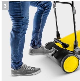
3 Удобная подножка