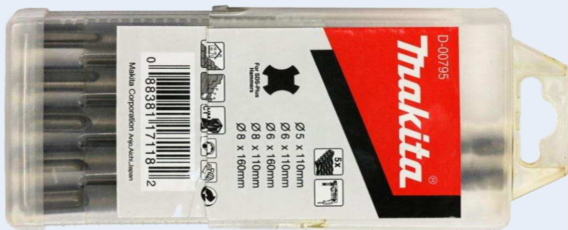
Набор буров из комплектации X5